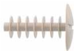
Zaślepka AD 12 x 40