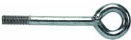
Śruba oczkowa do rusztowań FI G 12