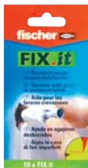
Wkładka naprawcza FIX.it