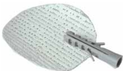
Wkładka naprawcza FIX.it