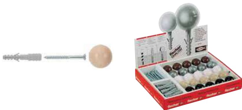
Ogranicznik drzwiowy TS