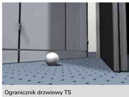
Ogranicznik drzwiowy TS