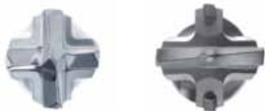
Detal: głowica wiertła